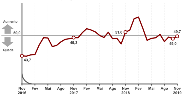
Número de Empregados