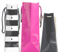
Consumer Goods & Manufacturing