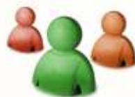
Redes de Relacionamento